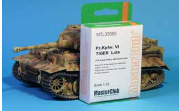
ティーガー後期用金属履帯