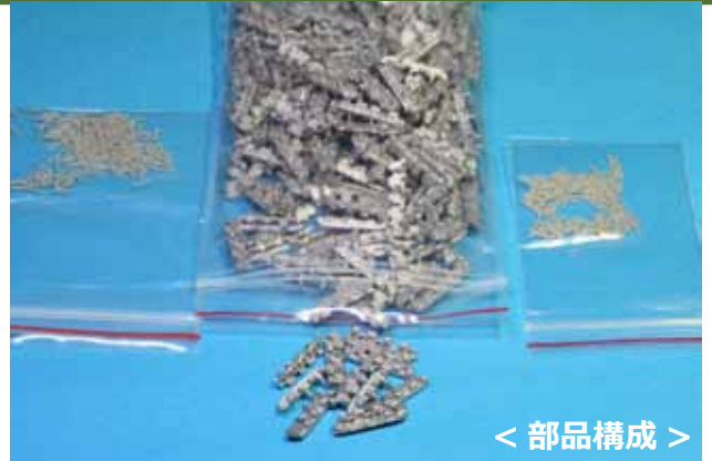
< 部品構成 >