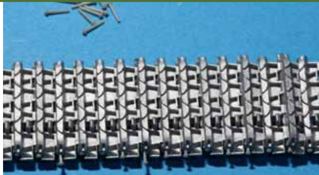
彫りが深くとてもイイ感じ!!