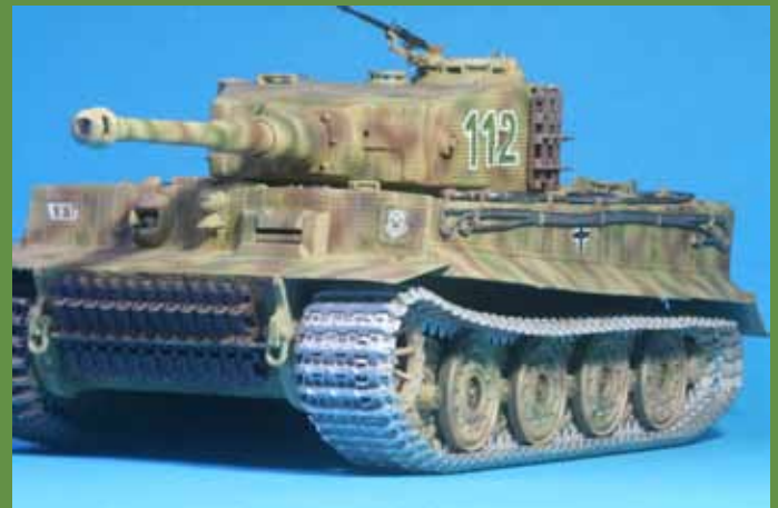
プラサフを吹き付けてから塗装すれば迫力満点です。