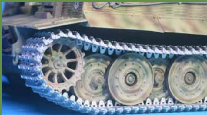
タミヤ 後期型に装着 (94 コマ使用)