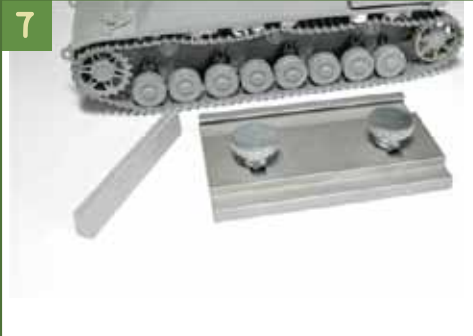
7 車体に履帯を取り付けた状態。